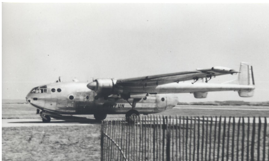
Nord 2501 F-WFUN au roulage à Bron