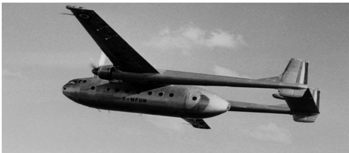
Nord 2501 F-WFUN en vol

Le programme prometteur du Meeting de l'Air du dimanche 6 juillet 1952 à Bron a attiré une foule considérable. Le centre d'essai de Brétigny-sur-Orge, en région parisienne, est particulièrement mis à l'honneur, avec la présence de plusieurs commandants et pilotes d'essai chevronnés. La présence du Nord 2501 'Noratlas', un fleuron de l'aviation française sera présenté en exposition statique. L'appareil présenté à Bron est le Nord 2501 n°2, immatriculé F-WFUN motorisé de deux moteurs Bristol 'Hercules' 758 de 2050 cv au décollage avec hélices à 4 pales Rotol, fabriqué dans l'usine de Sartrouville. Il a effectué son premier vol en décollant de Melun-Villaroche, le 28 novembre 1950 aux mains de Georges Détré.