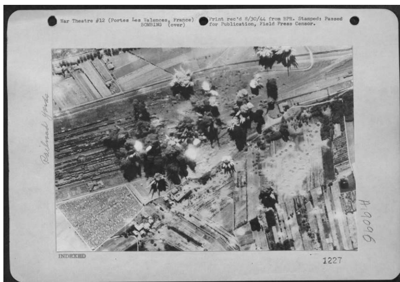
Bombardement du triage ferroviaire de Portes les Valence

Entre 11 h 11 et 11 h 13, 81 B 17 bombardent le triage ferroviaire de Portes les Valence. 1472 bombes (972 explosives et 500 à grande puissance), soit 243 tonnes sont larguées depuis 7000 mètres causant d'importants dégâts aux installations. On déplore de nombreuses victimes civiles dans le voisinage.