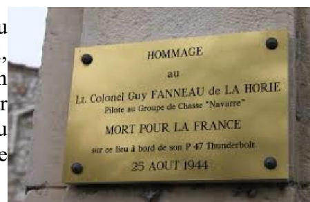
A l'emplacement de l'accident

quelques minutes plus tard, c'est l'appareil du Lieutenant Colonel de La Horie qui explose en touchant le sol, au quartier de Jarnias, sur la commune de Malataverne. En septembre 2003, un hommage a été rendu à ce pilote, par l'inauguration de deux plaques commémorative : l'une au Monument aux morts de Malataverne, l'autre sur le lieu de l'accident ;