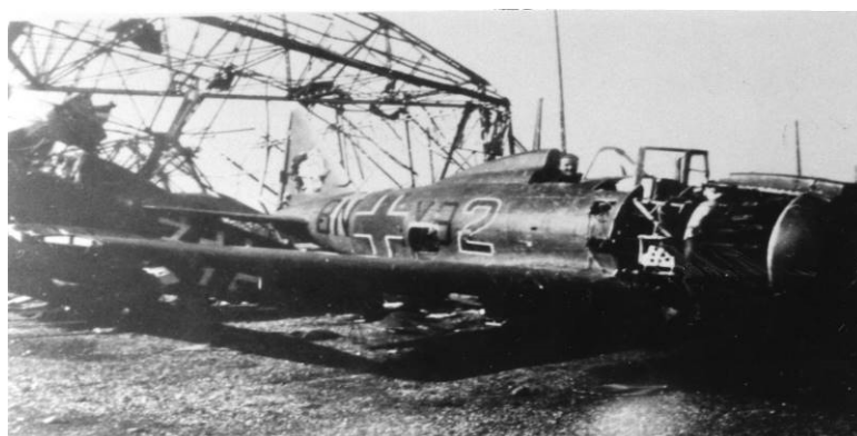
Reggiane Re 2002

Geschwader Bongart qui disposait fin juin 1944 de 35 (22 appareils opérationnels) Reggiane 2002 (de fabrication italienne provenant de prises de guerre), 6 (3) Junkers 88, 5 (2) Bf 109, 4 (2) Heinkel 46, 4 (2) Messerschmitt 110, 7 Focke Wulf 58, 3 (1) Heinkel 111, 1 (0) Dornier 217, 2 Fieseler Storch, et de quelques Gotha 145.. Le 22 juillet, l'escadre est disséminée sur les terrains d'Avord, Toulouse, Valence et Lyon, mais aussi à Nancy pour la 9 ème escadrille, à Aix en Provence-Lenfant pour la 10 ème escadrille, à Bourges pour les 7 et 8 ème escadrille, à Lissay-Lochy (au sud de Bourges) pour la 13 ème escadrille, et à Clermont Ferrand-Aulnat pour l'Etat Major du 4 ème Groupe avec les 11 et 12 ème escadrille. A la Libération, les épaves d'une dizaine de Re 2002 se trouvaient abandonnées sur les terrains de Valence-La Trésorerie et de Lyon-Bron.