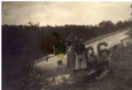
P 47 d'Ogden

2 nd Lt Ogden, se pose en catastrophe, sur les hauteurs de Loriol. Il rejoint rapidement les troupes alliées.