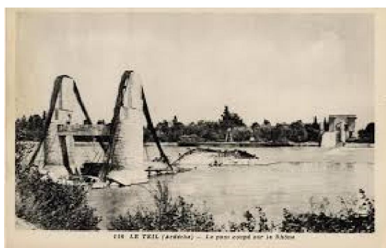
Bombardement du pont routier sur le Rhône au Teil

24 B 24 du 465 th Bomber Group larguent 135 bombes de 1000 lb depuis une altitude de 15000 pieds sur le pont routier, N-870528, sur le Rhône au Teil. Les bombardiers ont décollé du terrain de Pantanella (Italie du Sud).