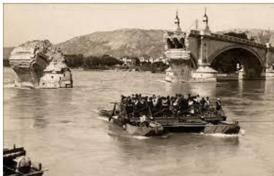
Destruction du pont de Valence

A 7 h 05, décollent du terrain de Ghisoccia (Corse), 18 B 25 du 310 th Bomber Group pour le bombardement du pont routier (O-009957) sur le Rhône à Valence. A 9 h 25, 72 bombes de 1000 lb sont larguées depuis une altitude comprise entre 9400/10500 pieds. Deux arches sont touchées. Les appareils sont de retour à leur base à 11h 25.