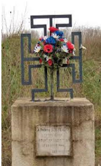
A l'emplacement de l'accident

vers 15 heures, l'appareil du Lieutenant Soubeyrat, touché par la Flak, s'écrase au lieu dit «Chabannas» sur la commune de Chateauneuf du Rhône. Une stèle commémore la mémoire du pilote.