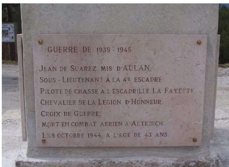
Plaque commémorative sur le Monument aux Morts d'Aulan