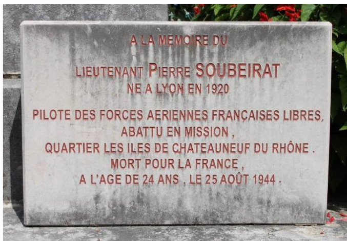
Au Monument aux Morts de Chateauneuf du Rhône

quelques minutes plus tard, c'est l'appareil du Lieutenant Colonel de La Horie qui explose en touchant le sol, au quartier de Jarnias, sur la commune de Malataverne. En septembre 2003, un hommage a été rendu à ce pilote, par l'inauguration de deux plaques commémorative : l'une au Monument aux morts de Malataverne, l'autre sur le lieu de l'accident ;