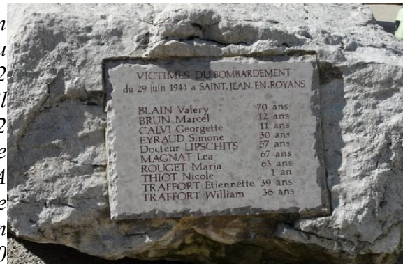
Bombardement de Saint Jean en Royans

Douze avions larguent leurs bombes sur Saint Nazaire en Royans faisant deux morts, trois blessés et de nombreuses maisons détruites. Au même moment, le bombardement par une dizaine d'appareils fait dix morts et quinze blessés à Saint Jean en Royans