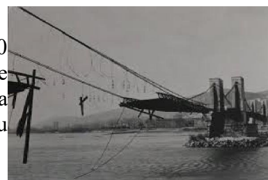
Bombardement du pont routier de Donzère

30 B 24 du 464 th Bomber Group larguent, vers 13 h, 140 bombes de 500 lb sur le pont routier, N-880412, sur le Rhône de Tusselage à Donzère. Le pont est touché entre la première et la deuxième pile sur la rive ouest. Les bombardiers ont décollé du terrain de Pantanella (Italie du Sud),