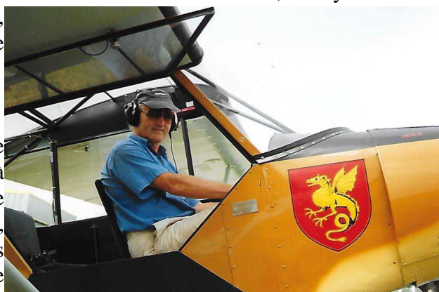
Le président Gilbert DARMON

*que depuis sa fondation, le nombre des pilotes brevetés à Pérouges est estimé : à 150 brevets entre 1952 et 1975, à 130 entre 1975 et 2012. De cette pépinière de pilotes, nombreux sont ceux qui volent dans des compagnies aériennes et dans l'Armée de l'Air;