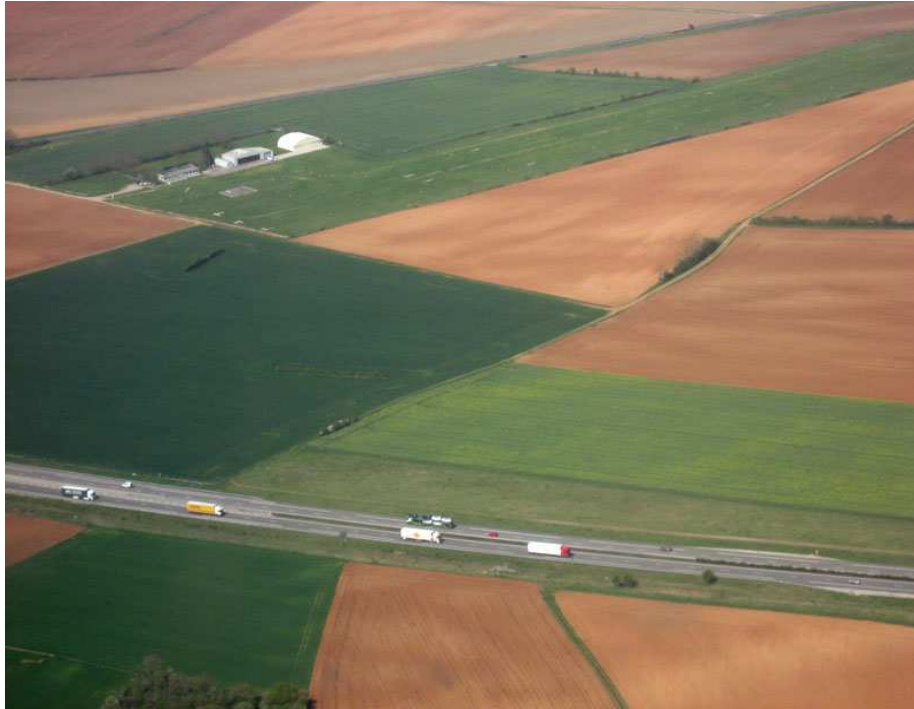
L'aérodrome de Pérouges en 2012

*achat d'un nouvel avion pour l'école de pilotage.